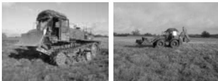
The DEUCE (left) and Light Wheeled Tractor (right) - both are air portable but there is a desire for them to be air droppable

trained and many individuals had inserted into the exercise area during the previous night by parachute. We also managed to witness the remainder of the Squadron arrive on the DZ during the course of the day.