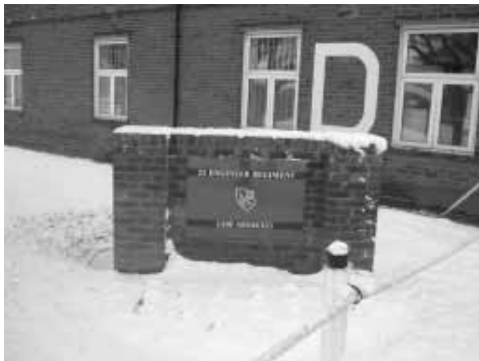
Headquarters 23 Engr Regt (Air Asslt)