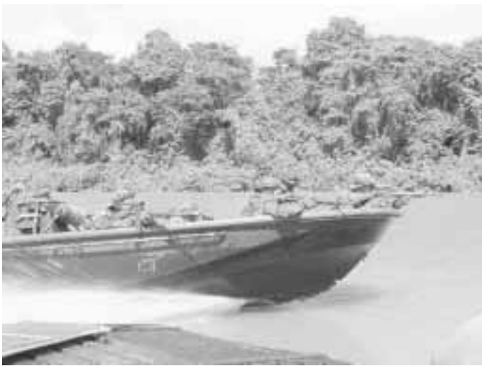
In de jungle gebeuren de meeste verplaatsingen via de bestaande waterwegen. De beschikbaarheid van een bootgroep is dan ook onontbeerlijk.

Waterbronnen zullen beschermd moeten worden. Over het algemeen is het voorhanden hebben van zuiveringsinstallaties voldoende om aan het benodigde water te komen.