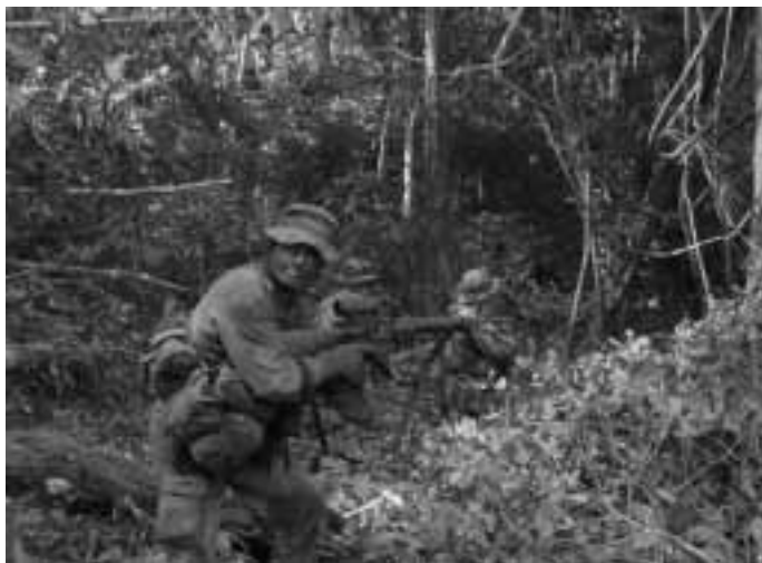
Tactische verplaatsingen door de dichte jungle worden vaker in meters dan in kilometers gerekend.

1339. Bescherming. Door de bijzondere aard van de omgeving wordt veel aandacht besteed aan bescherming. Het gebruik van geïmproviseerde en plaatselijke middelen speelt een belangrijke rol.