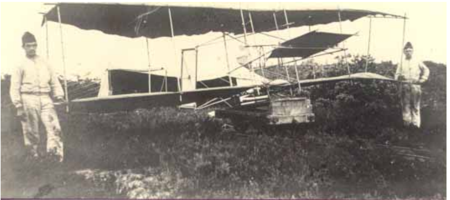
Oefeningen met een zweeftoestel type "Wright", omstreeks 1908