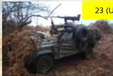
23 (UK) Engr Reg (Air Assault), international samenwerking werpt vruchten af.