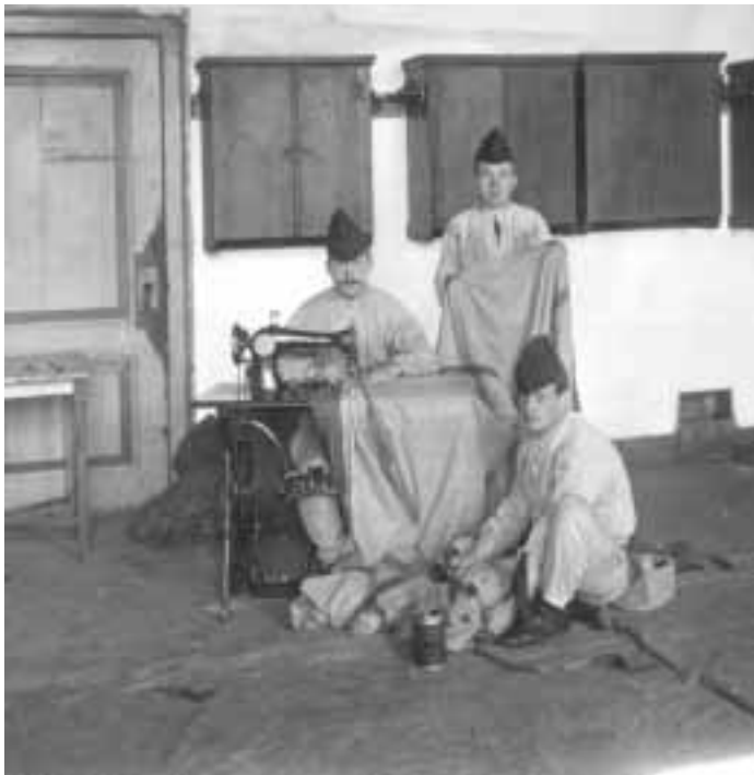
De ballonwerkplaats van het Regiment Genietroepen in 1905

Eén van de thema's, die momenteel worden uitgewerkt voor de nieuwe vaste presentatie van het Geniemuseum, is getiteld "Genie en nieuwe technieken". Nu is nieuw een ruim begrip. Hiermee bedoelen we aan te geven dat Genisten altijd betrokken zijn geweest bij de ontwikkeling van nieuwe technieken door de jaren, nee, eeuwen, heen. De betrokkenheid van de Genie bij de ontwikkeling van de luchtvaart is een onderwerp dat hierbij zeker aan bod zal komen. 2003 was een bijzonder jaar voor de luchtvaart. Het is 100 jaar geleden dat de gebroeders Wright hun eerste vlucht maakten, 90 jaar geleden werd de Militaire Luchtvaartafdeling opgericht. De Koninklijke Luchtmacht herdacht in 2003 haar 50-jarig bestaan als zelfstandig wapen.