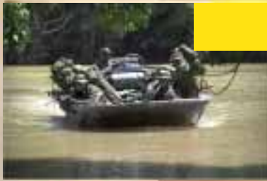
Jungle training binnen 11 Luchtmobiele Brigade (Air Assault)