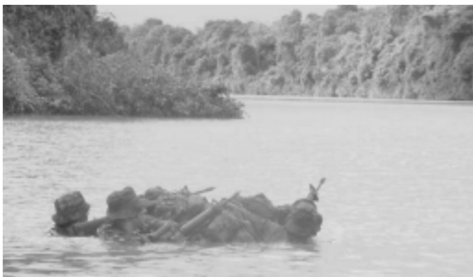
Het oversteken van waterwegen gebeurt op tactische wijze in pelotons- of groepsverband. De stroming van het water en de mogelijke aanwezigheid van krokodillen en piranha's vergt zowel mentaal als fysiek veel van de soldaten

Gezien de uitdrukkelijke wens van de Nederlandse regering een bijdrage te leveren aan de internationale rechtsorde en veiligheid is het zeker niet uit te sluiten dat Nederlandse eenheden in de nabije toekomst opnieuw worden ingezet in tropische gebieden. Het is dan ook essentieel dat hieraan serieus aandacht wordt besteed door het volgen van cursussen en het houden van oefeningen om daarmee expertise op te doen en in te bedden in de eenheid. Zeker voor snel inzetbare eenheden zoals 11 LMB zal er voorafgaande aan een eventuele inzet vaak geen tijd meer zijn om de benodigde ervaring op te doen. Binnen 11 LMB is dan ook een begin gemaakt met het opdoen van ervaring voor optreden in een jungle-omgeving.