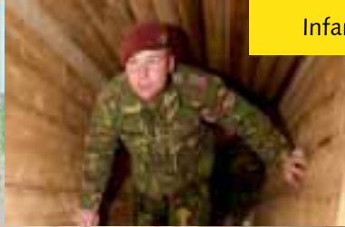
Infanterie Skill baan makkelijk aan te vragen voor niveau 2 en 3 oefeningen.