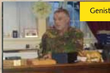
Genisten leveren goed werk onder primitieve en operationele omstandigheden.