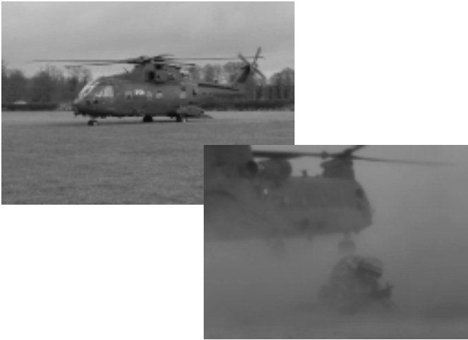
EH101(left) and CH-47 in action in Iraq

Being an air assault regiment, there of course is a high dependence on helicopters. 23 Engr Regt have experience imbedded from 51 Fd Sqn from its time with 24 Air Mobile Brigade in MND(C) and 9 Para Sqn from its time with 5 Airborne Brigade. During the visit we were fortunate to see the UK's new medium utility helicopter - the EH101 Merlin. Capable of carrying up to 24 fully equipped soldiers it promises to be a valuable addition to 16 Air Asslt Bde's armoury. The version we saw was being prepared to be a Command & Control helicopter for the Brigade Tac HQ.