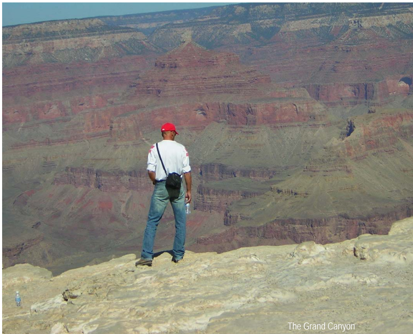
The Grand Canyon

Als laatste, loyaliteit aan het leger en de zorg voor soldaten is prioriteit nummer 1 voor de onderofficieren in de US Army en dat nemen ze bovenmatig serieus, het is voor de Amerikaanse onderofficier het ultieme om op missie te gaan met "zijn eenheid" en heelhuids terug te komen en wetende dat de missie een succes was en dat steken ze niet onder stoelen of banken. Ze zien dat als hun primaire taak en zullen zich zelden bemoeien met regelgeving en beleid. "We are there to execute orders", en praten dan vaak in de ik-vorm in relatie tot de eenheid. In het Nederlandse leger praten we vaker als onderoffi-