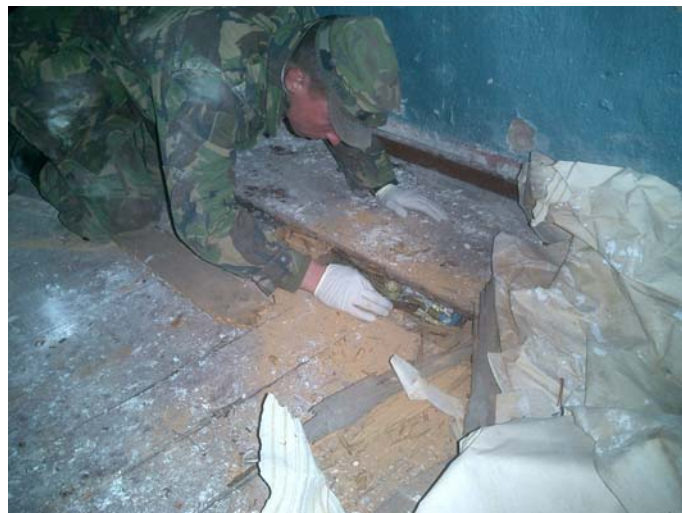
Gevonden! Semtex (kneedspringstof)

Komende periode zullen er middelen die benodigd zijn voor de BGTn (Basis Gevechts Technieken) van search instromen. Eerst zullen de eenheden die op uitzending gaan worden voorzien, daarnaast zal er een set komen voor opleiding en training op het OTCGenie en de overige parate genie-eenheden. De verdeling zal worden, dat er op elk geniepeloton een