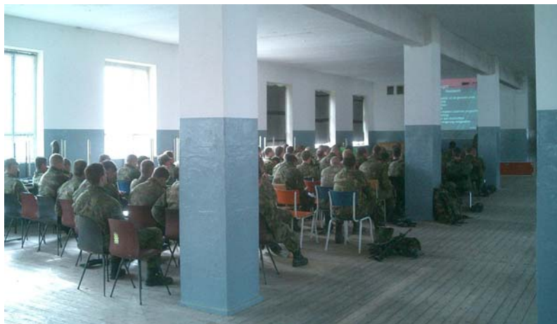
Klasikaal les aan drie maal 120 man

Zo werden steeds meer eenheden bekend met het fenomeen.