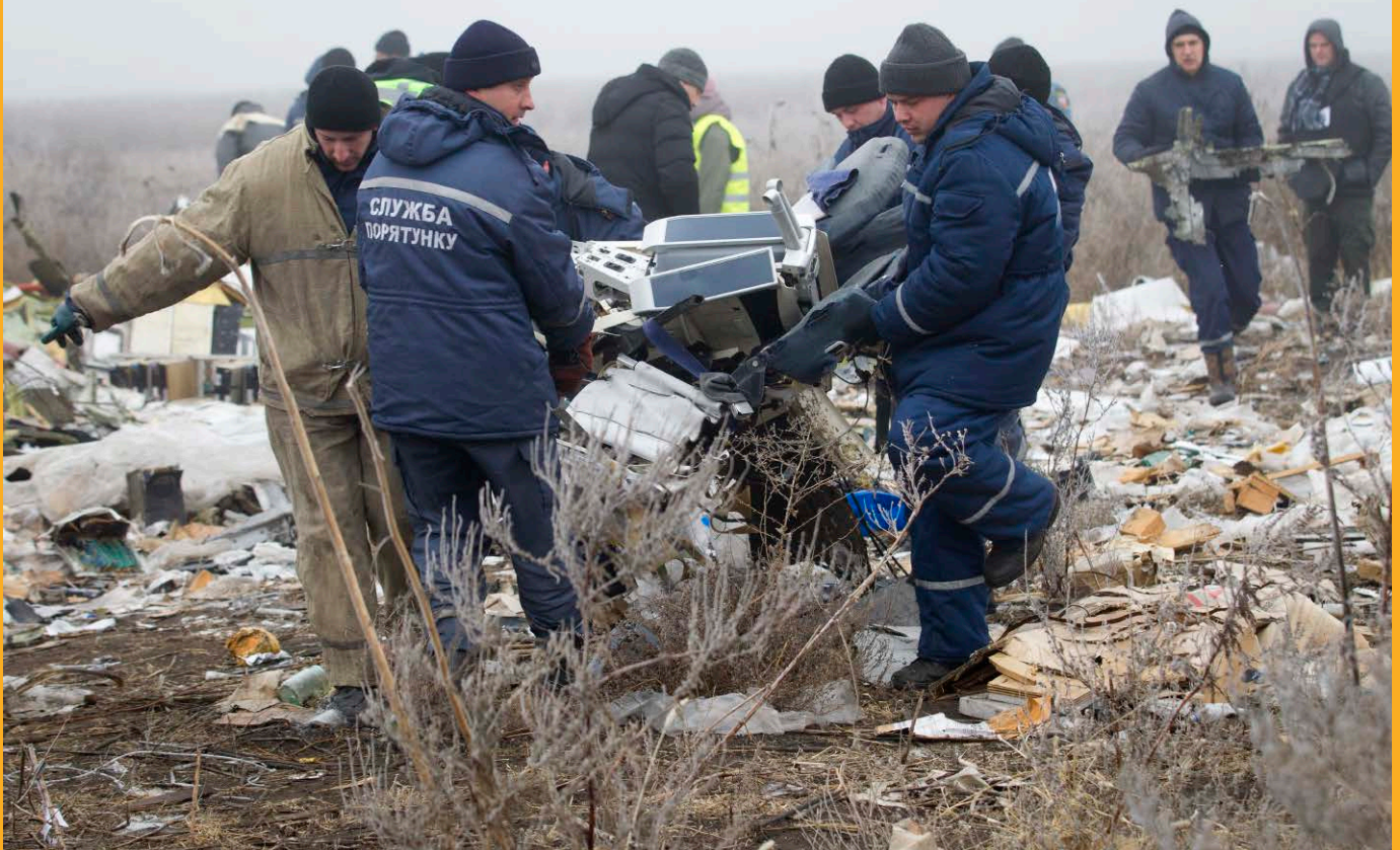
Medewerkers van de vrijwillige brandweer en leden van de SES bezig met het bergen van de wrakstukken

leeg. De winkels zijn veelal gesloten, de sporen van oorlogsgeweld zijn duidelijk zichtbaar en er heerst armoede en grote werkeloosheid. De beelden van de omgeving richting de stad zijn vergelijkbaar met de beelden uit het 'Bosnië tijdperk'. Je ziet kapotgeschoten infra, elektrische hoogspanningsmasten liggen omvergeschoten, veel roadblocks die spontaan zijn opgeworpen en de sporen van crisis zijn duidelijk zichtbaar. Ook het gevecht om het vliegveld in handen te krijgen is in volle hevigheid losgebarsten. Aangekomen onder begeleiding van de OVSE en de lokale politie in het hotel te Donetsk, blijkt het hotel het vaste onderkomen te zijn voor de OVSE, de nationale en internationale pers en ons team. Daags na aankomst kregen we toestemming om naar de crash-site af te reizen. Ook dit ging weer onder strikte bege- >>