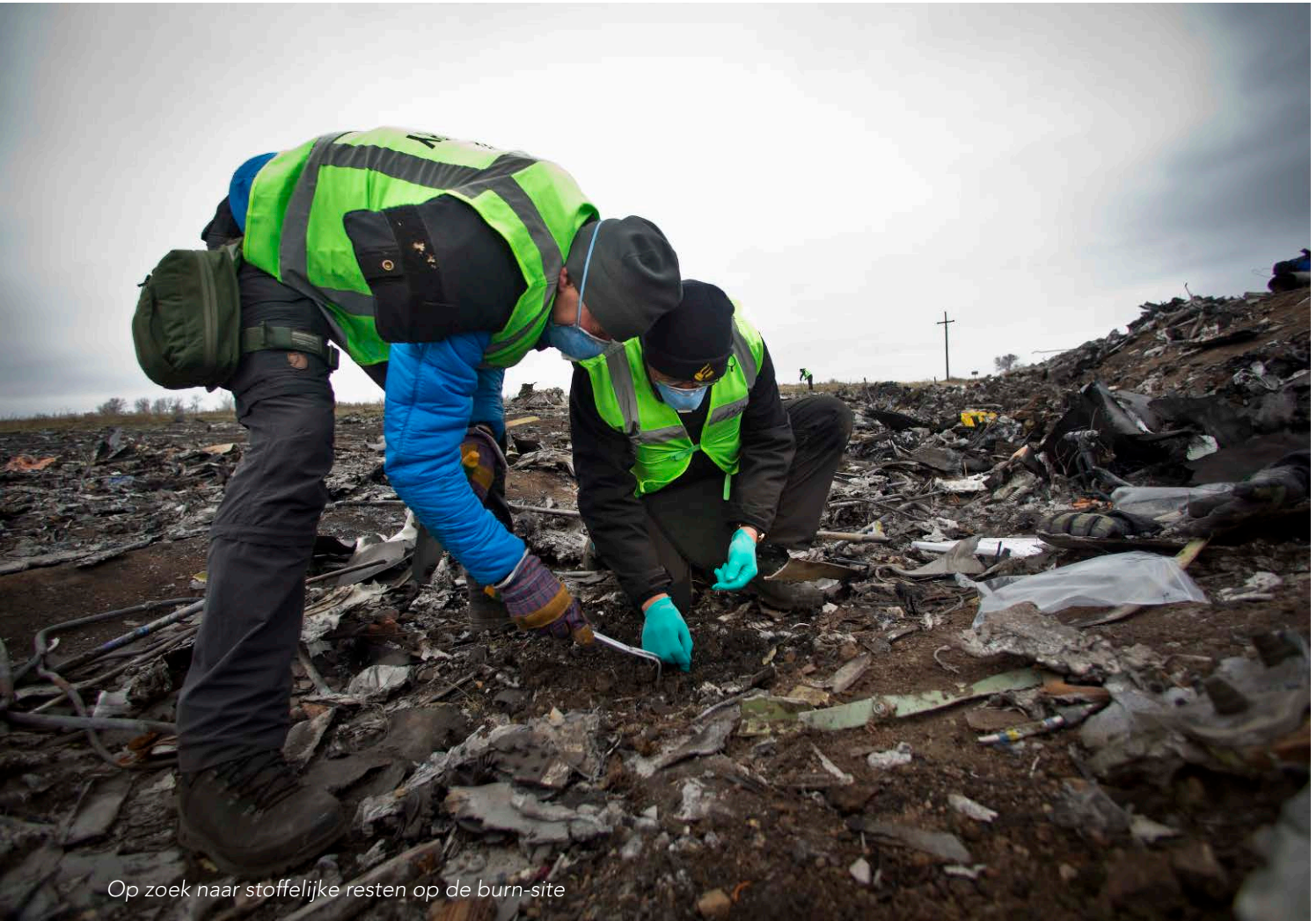
Op zoek naar stoffelijke resten op de burn-site

Bij aankomst in de Oekraïne werd ik op het vliegveld opgewacht. De herinneringen aan het EK voetbal van 2012 zijn nog duidelijk zichtbaar. Gelijk werd duidelijk dat de supporters van het Nederlandse voetbalelftal hier een goede indruk hebben achter gelaten, want als de lokale werknemer op de luchthaven in de gaten kreeg dat je uit Nederland afkomstig was, werd je hier nog met een grote glimlach aan herinnerd.