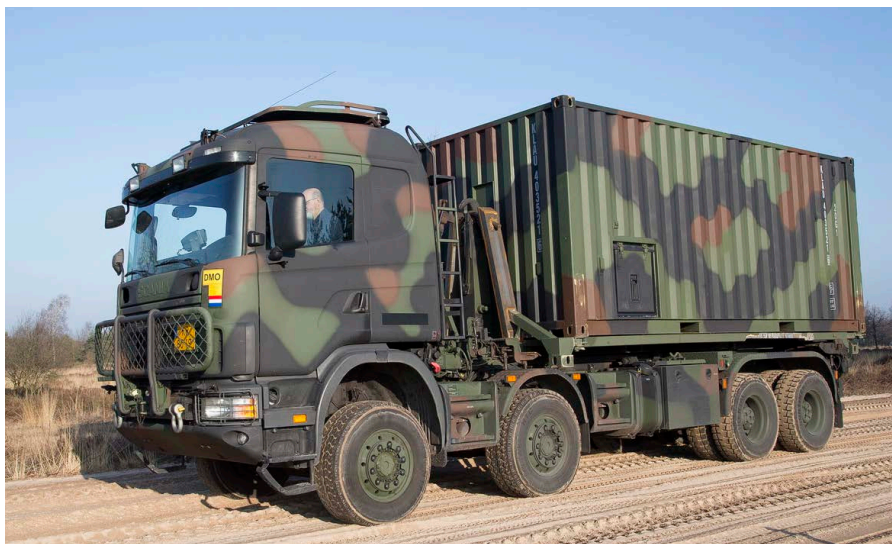
Tijdens de ontwikkelfase is de nieuwe container grondig getest. Zo ook in ruw terrein.

De huidige container is niet meer leverbaar door de fabrikant van destijds. Daarom is de nieuwe container op basis van de bestaande container ontworpen. Daarbij is ook de inrichting weer modulair uitgevoerd. Dit houdt in dat de werkbank, rekken en ladekasten verplaatsbaar zijn. De gebruiker kan hierdoor zelf bepalen hoe de container ingericht moet worden. Uiteraard is ook de mogelijkheid aangegrepen om diverse wijzigingen en verbeteringen door te voeren in het ontwerp. Deze hebben als doel om zowel de veiligheid als het gebruiksgemak te verbeteren. Ook is er voor de (elektrische) installaties gebruik gemaakt van de laatste technieken en