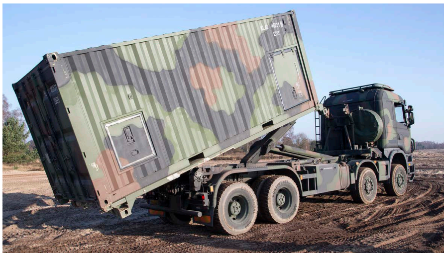
Afladen van de container.

wetgeving. Enkele voorbeelden van de verbeteringen en aanpassingen: