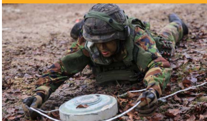
DEMOLITION & COUNTER-IED