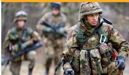
SEARCH / CBRN