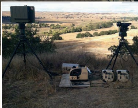
Optics and sensors

INI's pioneering Flex Fuel Generators with OMNIVORE™ Engine Technology, allows for the use of ANY FUEL, in ANY AOR, in ANY COMBINATION, thereby allowing War fighters to generate power from any military logistical fuel, in addition to any fuels available on the local economy, including contaminated fuels typically found in remote AORs for a wide-ranging number of mission sets.