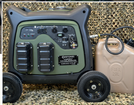
Sized from 500 to 5000 Watts (5kW shown)