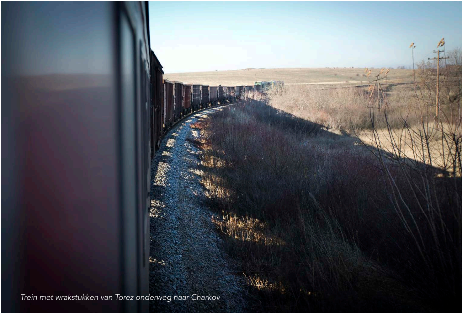
Trein met wrakstukken van Toren onderweg naar Charkov

konden voeren werd door ons zeer gewaardeerd.