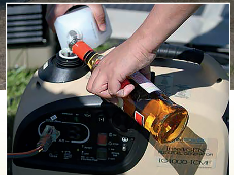
Any fuel in any combination