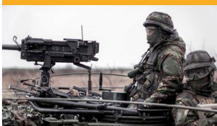
CAMOUFLAGE / PGU